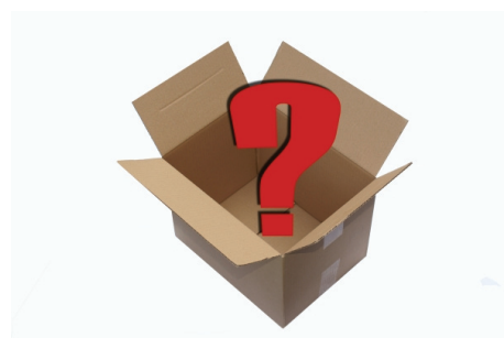
Erst fragen ...

* Weitere Informationen und Anmeldung beim FDI: http://www.fdi-ev.de/aktuelles/seminare-symposien