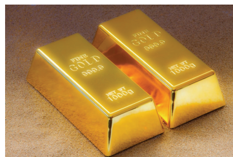
... und verdienen.